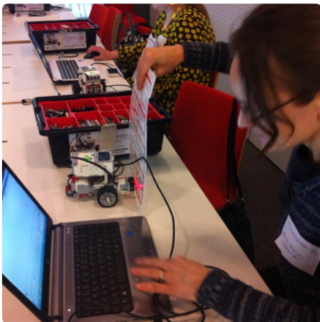
Opettaja tutkimassa ultraäänisensorin ja sitä lähestyvän kohteen tuottamaa graafia.

Data Logging -ohjelmistoa voidaan hyödyntää esimerkiksi mittaamisen ymmärtämisessä. Miten mahtaa moottorin teho vaikuttaa kuljettuun matkaan ja siihen käytettyyn aikaan? Entä millaisia kuvaajia saatkaan aikaan tuomalla liikuteltavaa kohdetta kohti ultraäänisensoria eri tavoin?